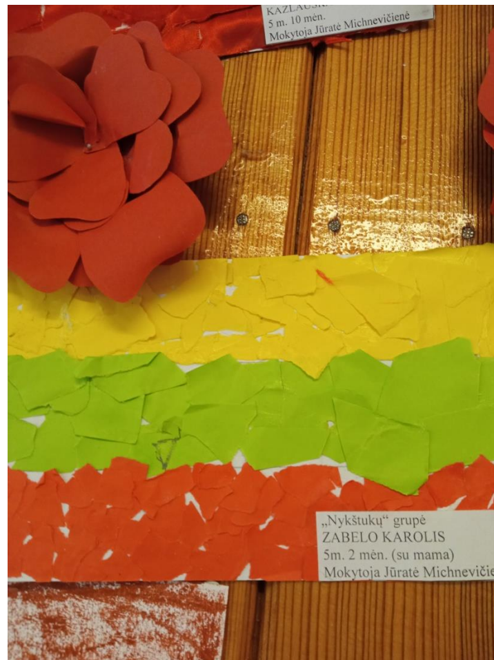
KAZLAUSKIS 5 m. 10 mėn. Mokytoja Jūratė Michnevičienė